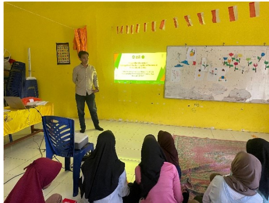
Gambar 2. Pelaksanaan Pelatihan

Penguasaan aplikasi seperti Microsoft Word, Excel, PowerPoint, dan lainnya dipandang sangat penting sebagai bekal bagi remaja dalam menempuh pendidikan lebih lanjut maupun memasuki dunia kerja kelak. Dengan menguasai keterampilan ini sejak dini, remaja akan memiliki nilai lebih yang dapat meningkatkan daya saing mereka di kemudian hari. Kegiatan ini dilaksanakan selama 2 minggu dengan hari Sabtu sore dan Minggu sore. Para remaja sangat antusias dalam mengikuti kegiatan ini. Kegiatan ini dilaksanakan di Gedung Posyandu Kelurahan Darusallam, Kecamatan Meral Barat, Kabupaten Karimun (gambar 2).