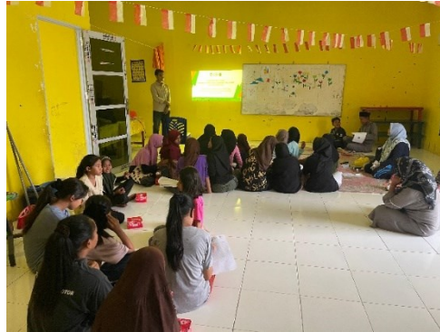
Gambar 3. Evaluasi Kemampuan Peserta Pelatihan

Pada gambar 3 merupakan tahapan evaluasi kegiatan. Proses pelaksanaan evaluasi yaitu dengan memberikan umpan balik dari peserta kegiatan melalui kuesioner, yang terdiri dari pemahaman materi, dan praktik Microsoft Office . Hasil evaluasi ditunjukkan pada tabel 1, dibawah ini.