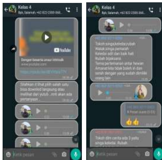
Gambar 1. Proses Pembelajaran Jarak Jauh

Berdasarkan hasil analisis data, siswa kelas IV SDN Kelutan dinyatakan terampil dalam mengomunikasikan pendapat menggunakan model pembelajaran Think-Talk-Write , karena dari 22 siswa diperoleh nilai t_{hitung} \geq t_{tabel} yaitu 9,507 \geq 2,080 dengan taraf signifikansi 5%. Hasil ini diperoleh karena dengan menggunakan model pembelajaran Think-Talk-Write dapat membantu siswa dalam membangun konsep atau ide secara mandiri (konstruktif) dan menuangkannya dalam bentuk komunikasi secara lisan maupun tulisan, sehingga dapat meningkatkan keterampilan mengomunikasikan pendapat. Hal ini dapat dilihat pada hasil pembelajaran menggunakan media whatsapp group sebagai berikut ini.