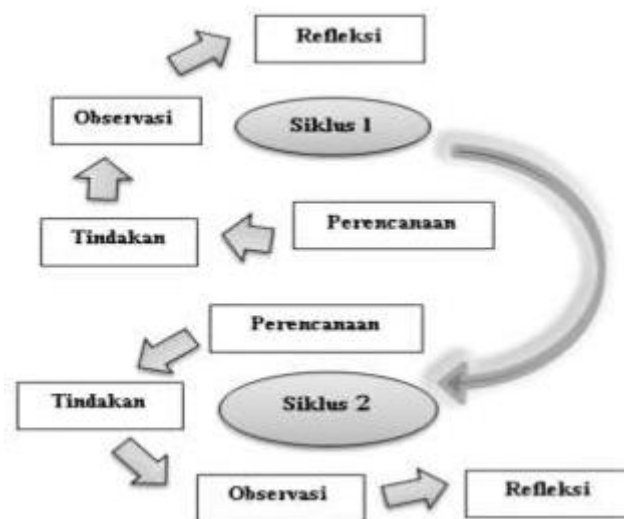
Gambar 1. Model Siklus Kemmis & McTaggart (Jannah et al., 2024)

Penelitian ini adalah Penelitian Tindakan Kelas (PTK) dengan model Kemmis and McTaggart (1988) (Gambar 1) yang dipadu dengan Lesson Study (LS) yang terdiri dari 3 siklus. Tahapan PTK-LS terdiri dari (1) perencanaan masuk dalam tahapan plan pada LS, (2) perlakuan dan pengamatan masuk dalam tahapan do pada LS, dan (3) refleksi masuk dalam tahapan see pada LS.